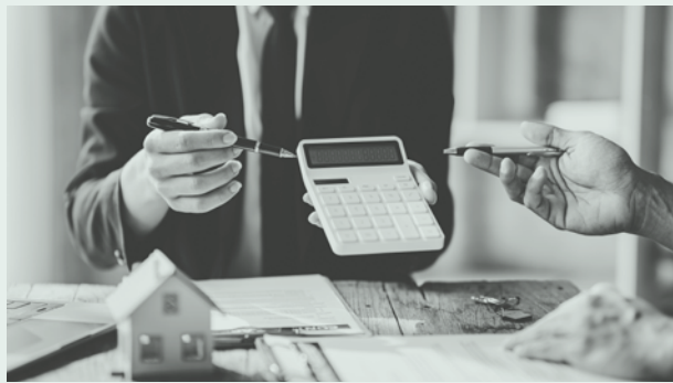
MAG. STEPHAN BERTUCH

Unabhängig davon hielt der OGH an seiner Entscheidung fest, dass eine Erhöhung des vertraglich vereinbarten Mietzins im Sinne der Bestimmung des § 6 Abs 2 Z 4 KSchG in den ersten beiden Monaten nicht vorgenommen werden darf. Demnach können Wertanpassungen erst ab dem dritten Vertragsmonat wirksam vereinbart werden. Anderes gelte nur, wenn die Wertanpassung für einen früheren Zeitraum im Einzelnen mit dem Verbraucher ausgehandelt worden ist.