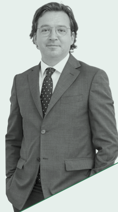
MAG. PHILIPP CASPER BAU- UND BAUVERTRAGSRECHT

INSOLVENZRECHT UND UNTERNEHMENSRESTRUKTURIERUNG WIRTSCHAFTSRECHT ZIVIL- UND UNTERNEHMENSRECHT